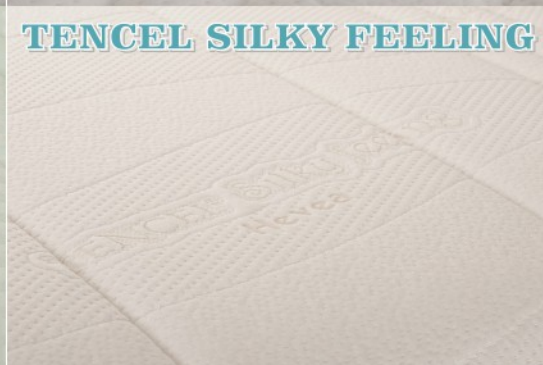
TENCEL SILKY FEELING