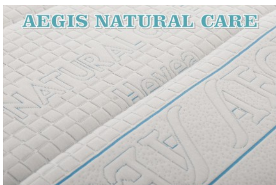
AEGIS NATURAL CARE