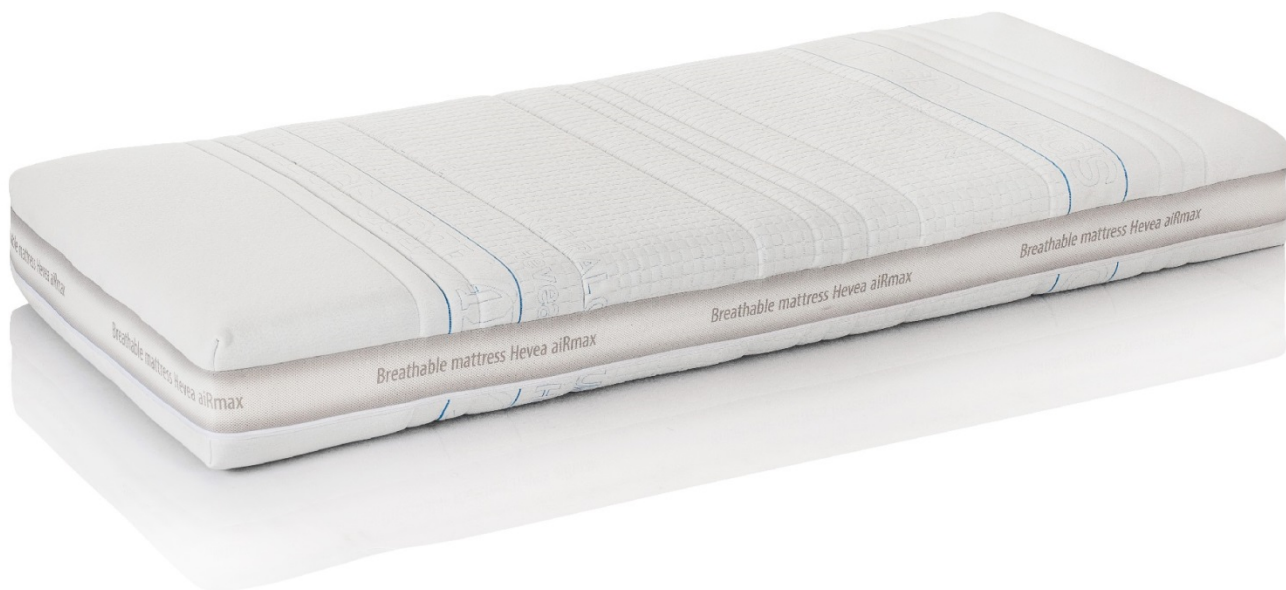
AEGIS NATURAL CARE